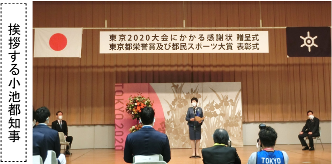
挨拶する小池都知事

感謝状を贈呈した。感謝状を受けたのは、日本医師会をはじめ医療関係団体と日本商工会議所、日本財団など39団体(公社)日本柔道整復師